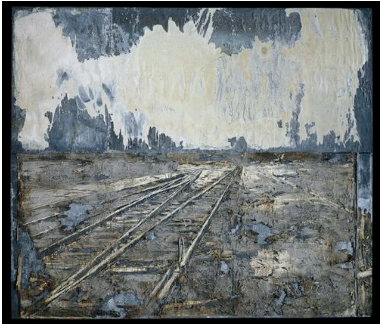
Anselm Kiefer: De vrouw van Lot

In 1965 gaat Anselm Kiefer rechten en Romaanse talen studeren aan de Universiteit van Freiburg. Van 1969 tot 1972 studeert hij bij Beuys aan de Kunstacademie van Düsseldorf, wat ook blijkt uit zijn materiaalkeuze. Voor zijn vuistdikke, reusachtige materieschilderijen gebruikte Kiefer alle denkbare materialen. Olieverf, acryl, teer, stro, haren, boomschors, zand en plantenresten. Hij bewerkte die met messen, beitels, een gasbrander en zelfs een bijl. "Mahlen ist Krieg", zegt hij.