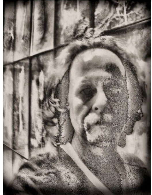
Anselm Kiefer: Zelfportret, 2008

De tentoonstelling 'De 20 ste Eeuw' in het Haags Gemeente Museum biedt het gebruikelijke overzicht van een kunstgeschiedenisboek: een historische opsomming van stijlen en stromingen te beginnen bij de expressionisten en eindigend bij moderne individualisten als Jeff Wall en zijn metersgrote dia's. Maar er is meer en dat vind je ook terug in de catalogus: opmerkelijke toelichtingen bij de kunstwerken in de zalen en introductiefilmpjes in zijkamertjes. De toelichtingen zijn geschreven vanuit het perspectief van het gewone kunstminnende publiek dat musea bezoekt, opkeek van al dat modernistische gedoe en het eigenlijk niet kon plaatsen. Uit alles bleek dat met name de Haagse School met Mesdag, Maris en Mauve in Nederland tot in de jaren '60 smaakbepalend waren. Dat waren tenminste schilders die schilderden in de stijl van Rembrandt. Het Nederlandse kunstminnende publiek bleek heel dus behoudend. Ook mensen als de architect Berlage zagen niets in het moderne abstracte werk van Mondriaan. Mondriaan vertrok naar Parijs om daar zijn abstracte composities met rode, gele en blauwe vlakken te ontwikkelden. In de jaren '50 begonnen Karel Appel en zijn vrienden in Parijs met Cobra, want het Nederlandse kunstklimaat was te beknellend. Pas ver in de tweede helft van de twintigste eeuw veranderde die stemming.