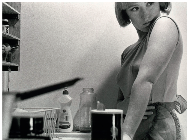
AFBEELDING1 Cindy Sherman, Filmstill zonder titel #3 (1977).