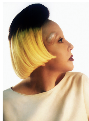
AFBEELDING2 Orlan, foto door Fabrice Lévêque (1997).

A Orlan past haar lichaam aan aan eerdere schoonheidsidealen. Hier gebruikt ze bijvoorbeeld een schoonheidsideaal uit de renaissance, dat je ook ziet op afbeelding 3. Wat is dat renaissance-ideaal dat Orlan namaakt?