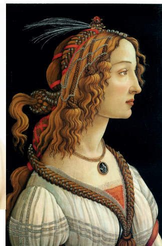
AFBEELDING3 Sandro Botticelli, Portret van een jonge vrouw (1485).