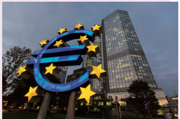
Afb. 3.13 Het euroteken voor de Europese Centrale Bank in Frankfurt.

vanaf 1985: Verdrag van Schengen (en uitbreidingen), waardoor het makkelijker werd om in andere Europese landen te werken