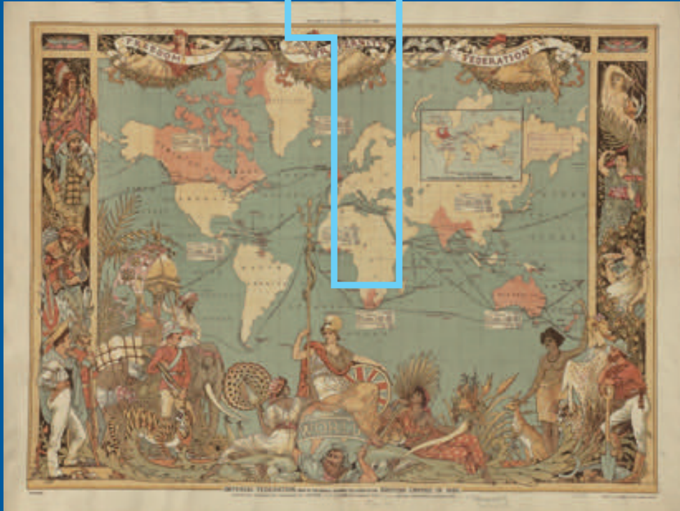
Afb. 1.1 Kaart van het Britse wereldrijk in 1886. De landen in het roze behoorden op dat moment tot Groot-Brittannië.