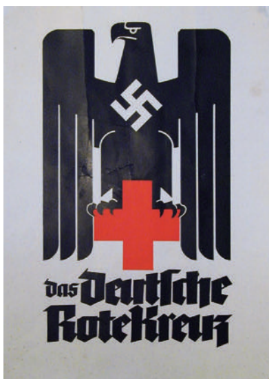
Bron 2.2 Het logo van het Duitse Rode Kruis in de periode 1933-1945.