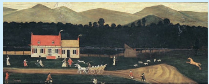
Afb. 1.5 De boerderij van de Nederlandse familie Van Bergen, vlakbij Albany, New York (detail, 1733).

1616: eerste tot slaaf gemaakte Afrikanen komen in Jamestown aan