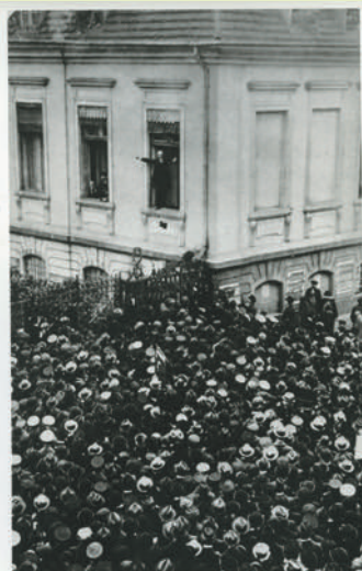
Afb. 2.2 Scheidemann roept de republiek Duitsland uit, vanuit het raam van de Rijkskanselarij (9 november 1918).

Op 11 november 1918 werd de wapenstilstand ondertekend door vertegenwoordigers van de nieuwe Duitse burgerregering in een treinwagon bij de Franse plaats Compiègne. De Eerste Wereldoorlog was voorbij. Het keizerrijk had opgehouden te bestaan.