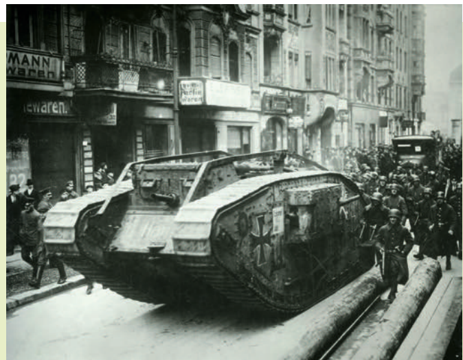
Afb. 2.3 Regeringstroepen op weg naar de Alexanderplatz in Berlijn. Daar hielden linksradicale aanhangers eenstaking tegen de nieuwe democratische regering, omdat ze een communistische samenleving wilden naar Russisch voorbeeld (maart 1919).

Januari-maart 1919: communistische opstanden tegen de nieuwe regering