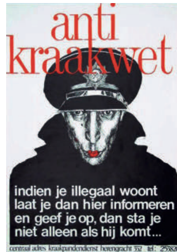
bron 3.5 affiche van de Kraakpandendienst (1978).