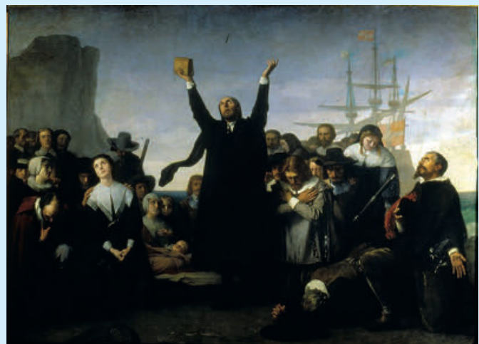
Afb. 1.3 Antonio Gisbert, Het vertrek van de puriteinen naar Amerika in 1620 (1883).