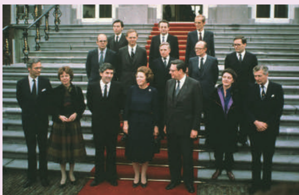
Afb. 3.12 Kabinet-Lubbers I op het bordes van Paleis Huis ten Bosch, met midden vooraan koningin Beatrix en links naast haar Ruud Lubbers (4 november 1982).

Omdat het slecht ging met de economie eisten veel werknemers hogere lonen, die werkgevers om dezelfde reden niet konden of wilden betalen. In 1982 gingen werknemers- en werkgeversorganisaties samen met het kabinet om de tafel zitten en kwamen ze tot een compromis in het Akkoord van Wassenaar, waarbij een loonmatiging werd afgesproken. Dat hield in dat de lonen niet verder omhoog zouden gaan (loonmatiging), maar werknemers in ruil daarvoor wel minder uren hoefden te werken (arbeidstijdverkorting). Het Akkoord van Wassenaar wordt gezien als het ontstaan van het poldermodel (ook wel consensusmodel genoemd), waarbij overheid, werknemers en werkgevers gezamenlijk onderhandelen en compromissen sluiten. Omdat alle partijen een beetje hun zin krijgen, is het gevolg vaak politieke en economische rust.