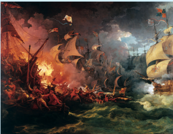
Afb. 1.2 De val van de Spaanse Armada in 1588. Een schilderij van de Frans-Britse schilder Philip James de Loutherbourg uit 1796.

Begin zeventiende eeuw werd geprobeerd een tweede kolonie in Virginia te stichten. Een aantal kooplieden in Londen waren een bedrijf begonnen met als doel handel te drijven met de inheemse bevolking in de Nieuwe Wereld. Dit bedrijf werd de Virginia Company of London gedoopt, en net als bij de VOC in de Nederlanden kon iedereen aandelen in het bedrijf kopen (zie KA 25 ). De compagnie stichtte in 1607 de kolonie Jamestown. Net als Roanoke lag deze ver genoeg uit de buurt van Spaans Florida om veilig te zijn voor directe aanvallen, maar dichtbij genoeg voor kaapvaart. Na Jamestown werden er steeds meer koloniën gesticht langs de Noord-Amerikaanse kust, van Virginia in het zuiden tot Canada in het noorden.