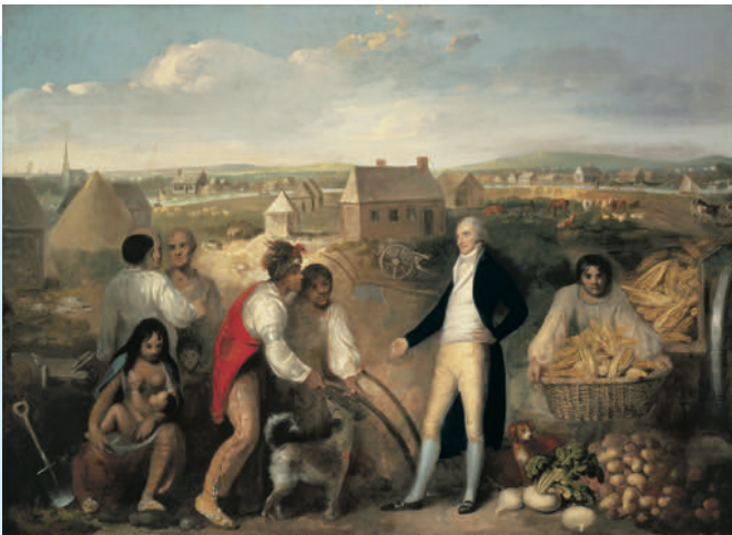
Afb. 1.4 Portret van kolonist Benjamin Hawkins op zijn plantage in Georgia (1805). Hij legt aan de indianenstam de Creek uit hoe ze een ploeg moeten gebruiken.

Ze zagen zichzelf als geciviliseerde mensen die ver boven deze halve wilden stonden. Velen vonden het daarom niet kwalijk dat ze het land van de indianen innamen. De paarden en vuurwapens werden steeds vaker tegen de indianen ingezet om land te veroveren. Vanuit winstoogmerk denkende kooplieden zagen de indianen ook wel als toekomstige – al dan niet vrijwillige – arbeidskrachten voor de nog op te richten plantages of voor de mijnbouw. De kolonisten kwamen er echter al snel achter dat indianen geen makkelijke slaven waren; ze ontsnapten om de haverklap omdat ze het land zo goed kenden, waren koppig en weigerden te werken. De indianen stonden ondertussen niet zonder meer toe dat vreemdelingen hun wereld binnendrongen. Er kwamen steeds meer bloedige conflicten tussen kolonisten en indianen over de levering van voedsel of over landbezit. Veel indianen stierven aan voor hen onbekende Europese ziekten waar zij geen antistoffen tegen hadden, zoals de griep. Toen kolonisten door hadden dat indianen niet bestand waren tegen Europese ziekten verspreidden zij soms opzettelijk besmette dekens onder de indianen. Ook maakten Europeanen veelvuldig gebruik van bestaande conflicten tussen inheemse volkeren onderling. Zij trokken om de beurt partij voor verschillende volkeren en lieten hen in ruil daarvoor voor de Europese legers vechten. Uiteindelijk droeg dit allemaal bij aan het verdwijnen van een heel groot deel van de inheemse bevolking.