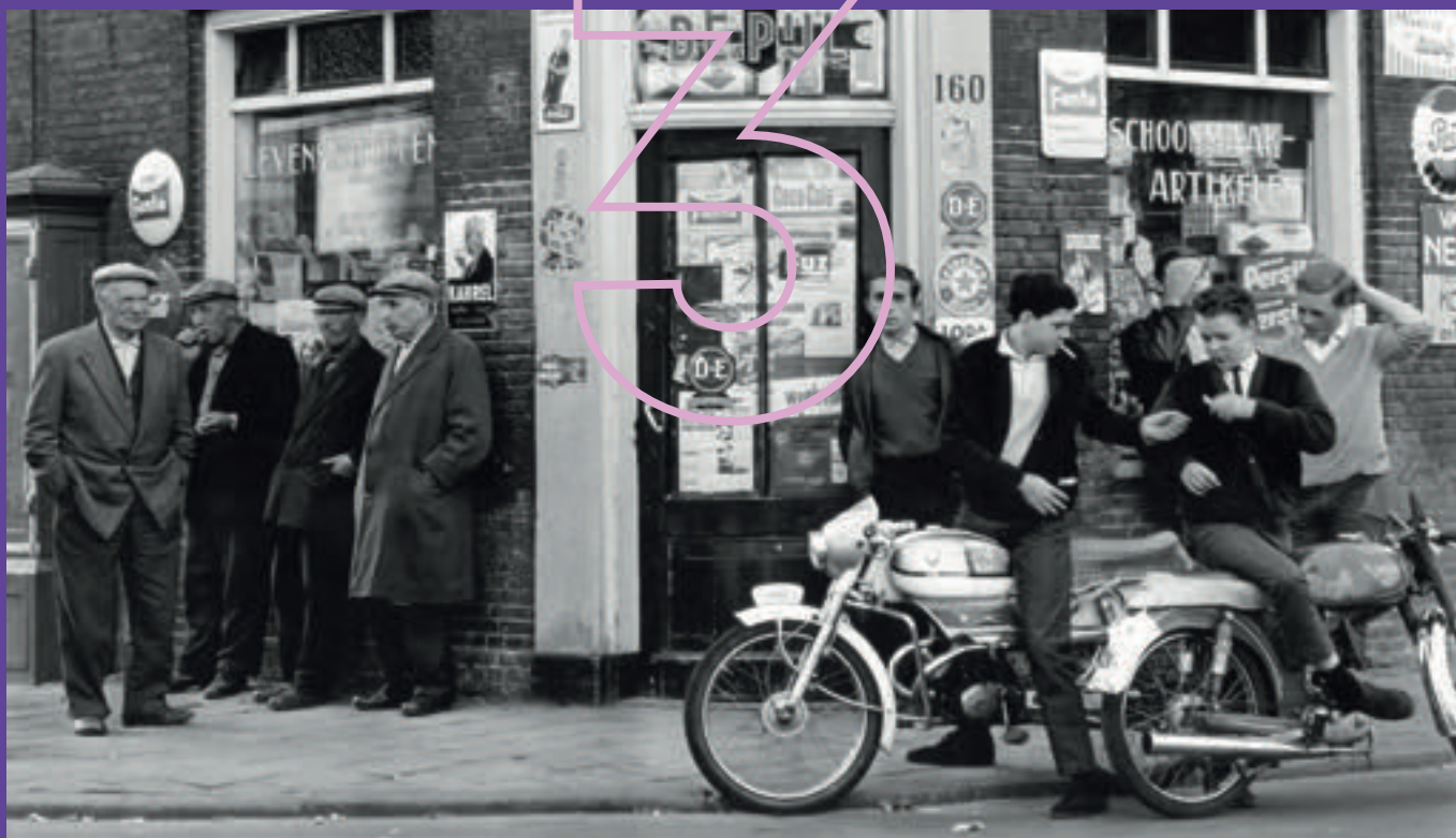
Afb. 3.1 Tijden veranderen: de oude generatie (links) kijkt afkeurend naar de rondhangende nozems op hun brommers. Nozems vormden een opstandige jeugdcultuur in de jaren zestig in Nederland.