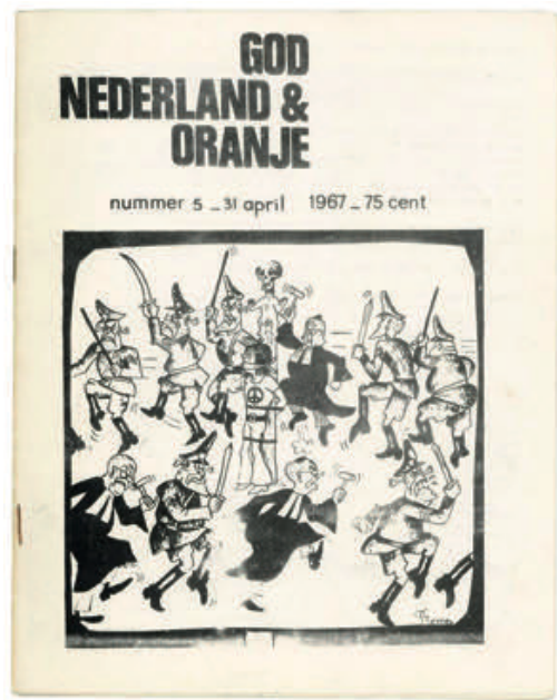
Bron 3.4 voorkant van het Provoblad God, Nederland & Oranje (1967).