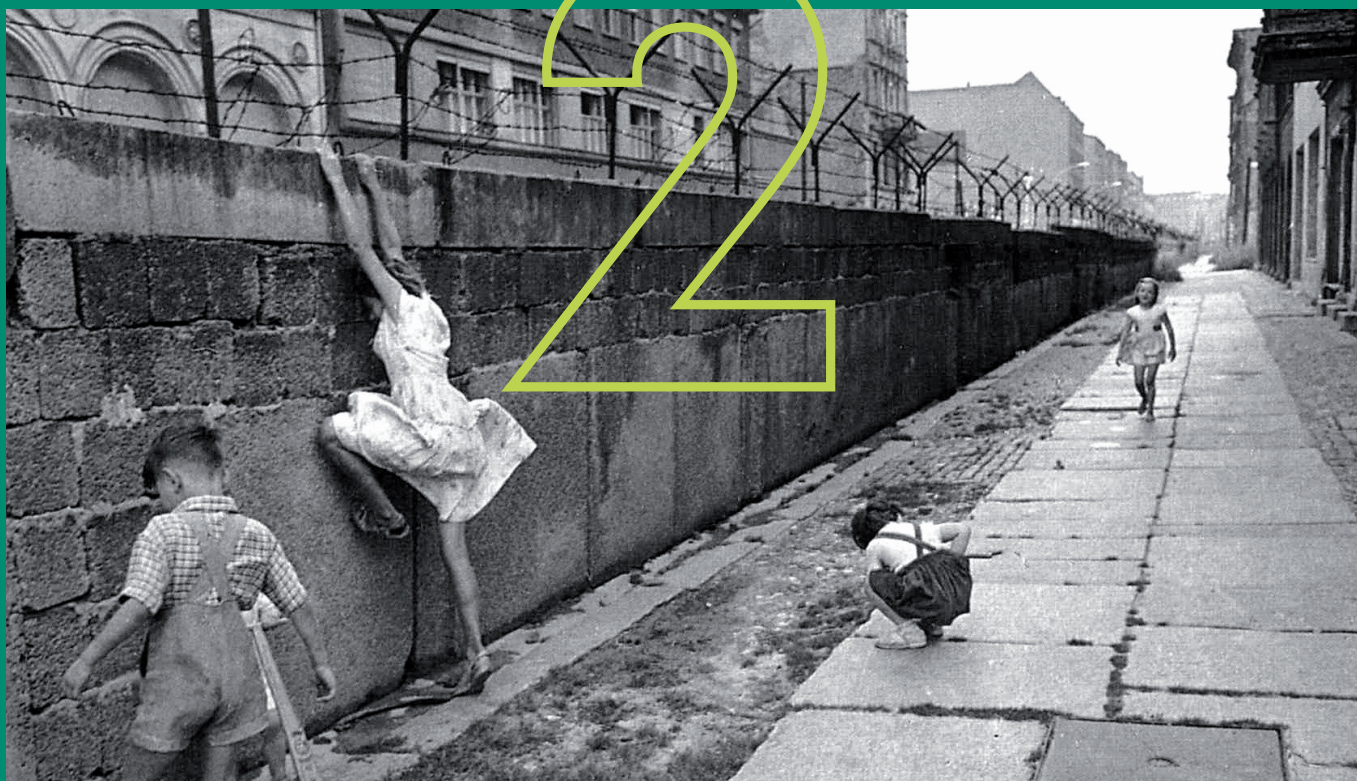
Afb. 2.1 Spelende kinderen bij de Berlijnse Muur aan de West-Duitse kant (1962). De Muur verdeelde van 1961 tot 1989 Duitsland in een kapitalistisch West-Duitsland, de BRD, en een communistisch Oost-Duitsland, de DDR.