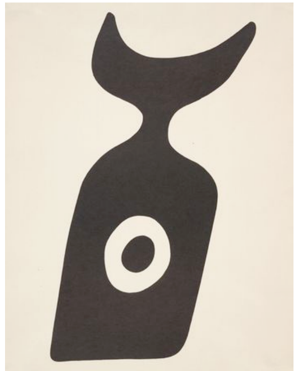
Jean Arp The Navel, 1923

Over het abstracte werk van Jean Arp wordt gezegd dat hij het maakte met behulp van toeval en automatisme. Hij maakt organische vormen die gedaantes suggereren. Zijn gedichten maakt hij soms ook met behulp van het toeval. Hij knipt bijvoorbeeld zinnen in stukken, gooit ze op de grond en stelt daaruit willekeurig een gedicht samen.