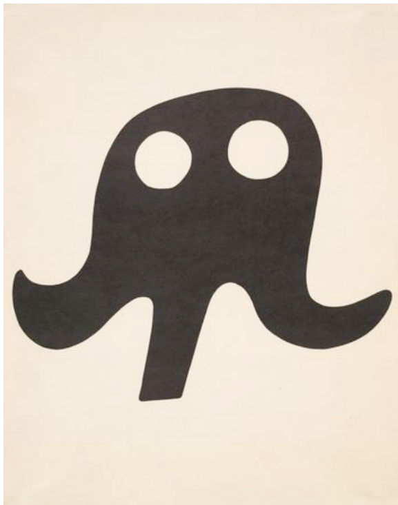
Jean Arp Moustache Hat, 1923

Na zijn opleiding kunstnijverheid bij de École des Arts et Métiers in Straatsburg, ging Arp naar Parijs, waar hij voor het eerst gedichten publiceerde. Tussen 1905 en 1907 studeerde Arp aan de Kunstschule in Weimar in Duitsland. In 1908 ging hij terug naar Parijs om de Académie Julian te bezoeken. In 1912 deed hij mee met de tentoonstelling Der blaue Reiter. Van het werk uit de periode tot ongeveer 1914 is niets meer over, omdat Arp het zelf heeft vernietigd. Naar het schijnt was dit expressionistisch van aard. In 1915 ontmoette hij Sophie Taeuber, met wie hij samen werkte aan papiercollages. In 1921 traden zij in het huwelijk.