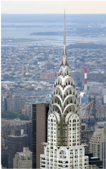
Chrysler Building, New York

geometrische motieven als zigzagpatronen en bliksemflitsen. De nadruk op stilering en abstracte vormen heeft te maken met de groeiende invloed van de machinale vormgeving en het kubisme.