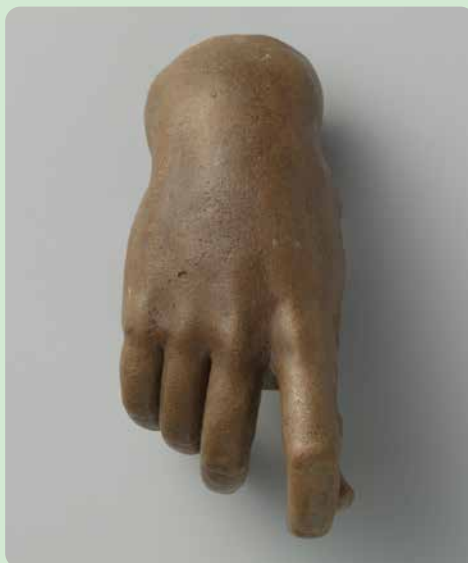
2.12 Johan Gregor van der Schardt, Studiemodellen van lichaamsdelen (ca. 1560-1570).