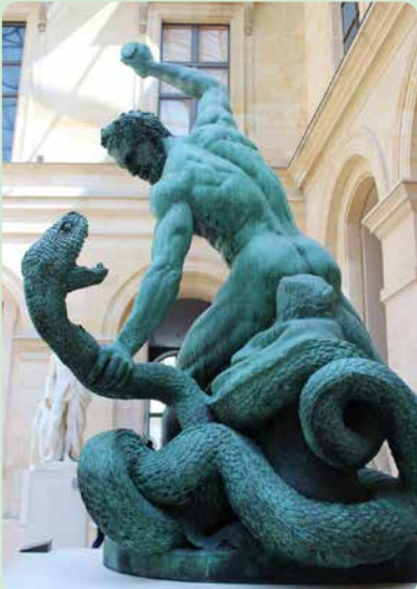
2.3 François Joseph Bosio, Hercules en Achelous (1814-1824).