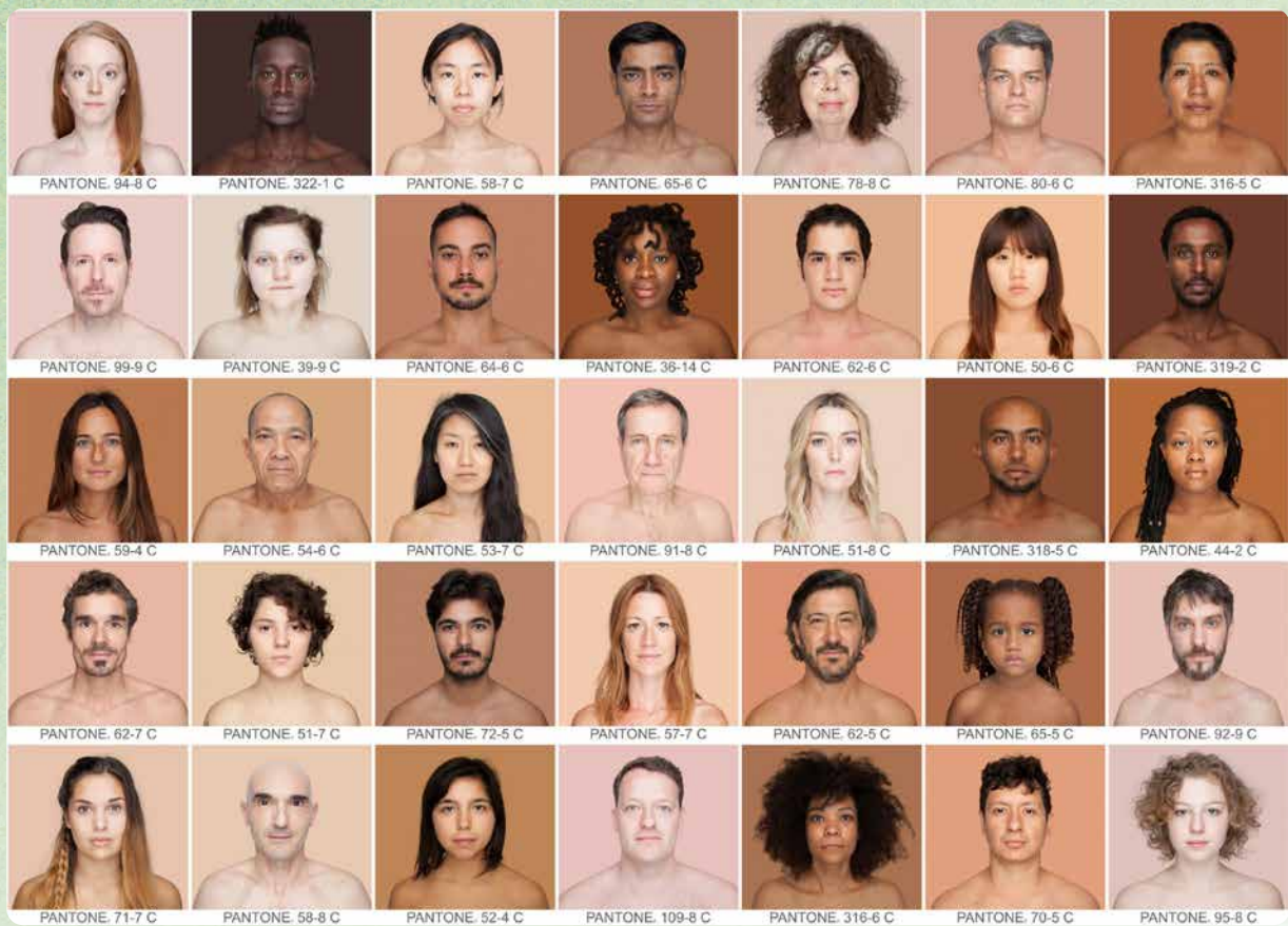
2.14 Angélica Dass, Humanae (sinds 2012).