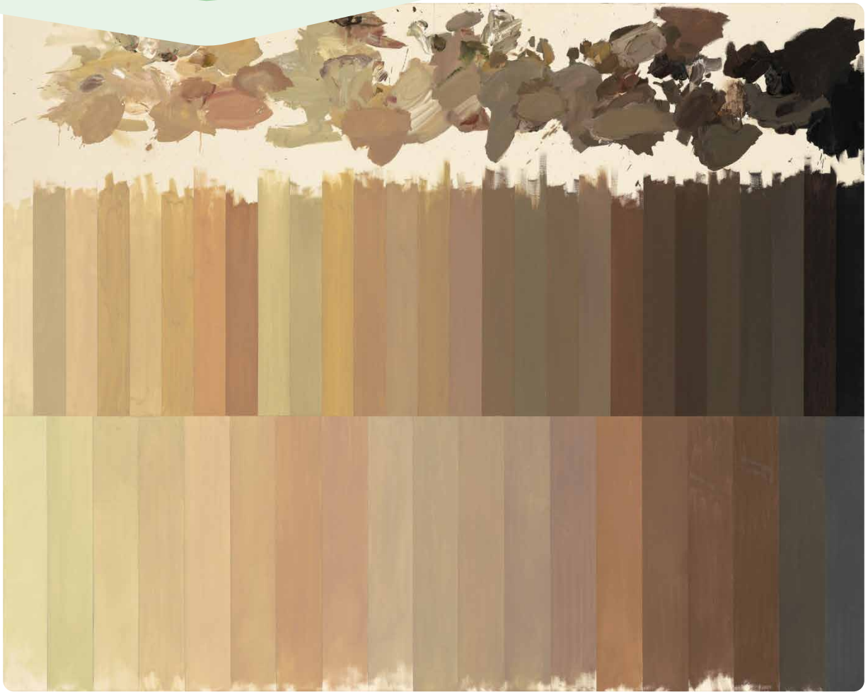
2.15 Roy Villevoe, Verf&make-up/Lichaam&ziel (1990).