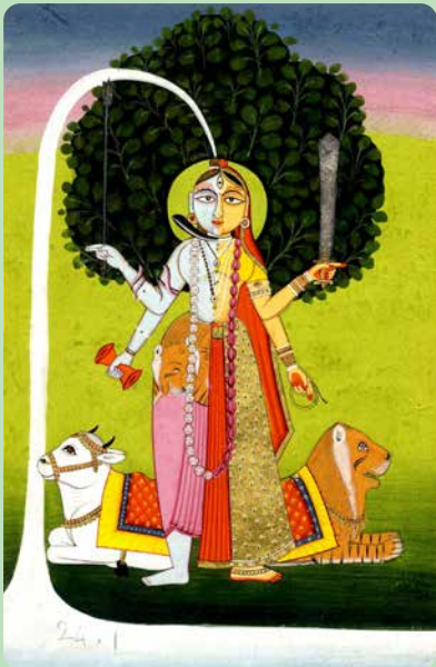
2.5 Onbekend, Ardhanari staand (circa 1800).