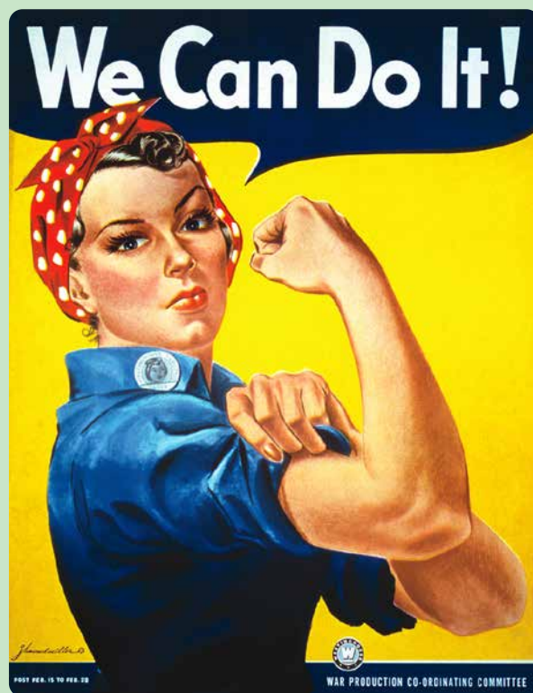
2.21 J. Howard Miller, We Can Do It! (We kunnen het!) (1943).