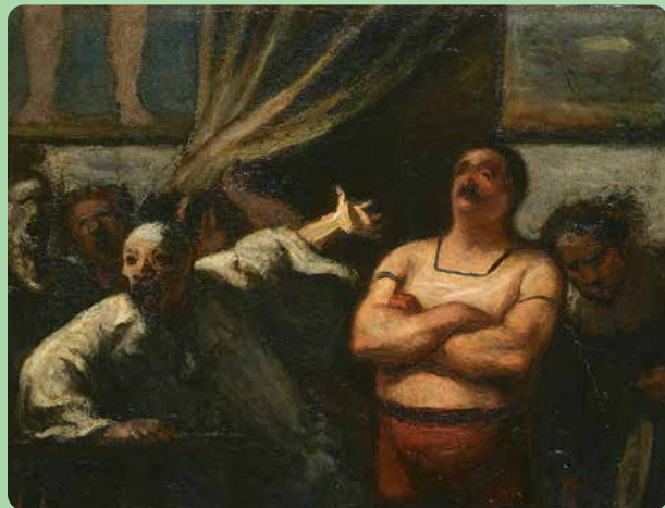
2.4 Honoré Daumier, De sterke man (ca. 1865).