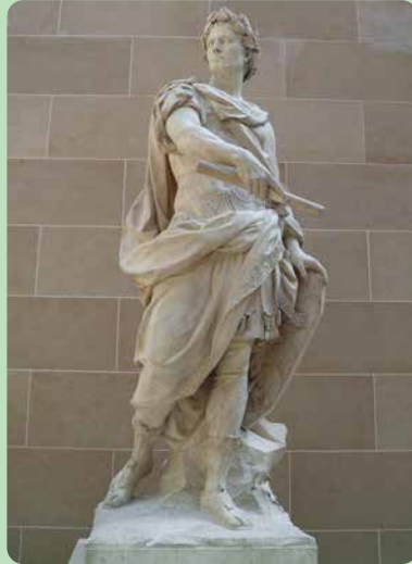
2.8 Nicolas Coustou, Julius Caesar (1696).