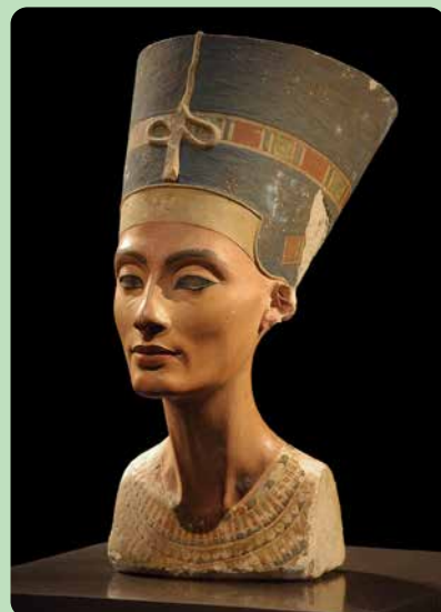
2.13 Onbekend, Nefertiti (1352-1338 v.Chr.).