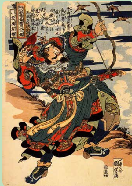
2.2 Utagawa Kuniyos, Shoriko Kaei schiet een wilde gans (ca. 1820).