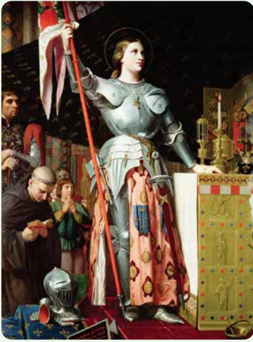
2.7 Jean-Auguste-Dominique Ingres, Jeanne d'Arc bij de kroning van Karel VII (1854).