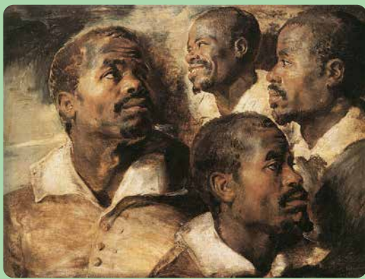
2.10 Peter Paul Rubens, Studie van vier hoofden (1613).