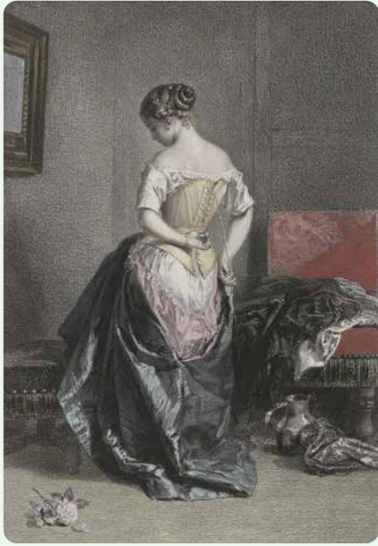
2.1 Adolphe Mouilleron, Het korset (1856).