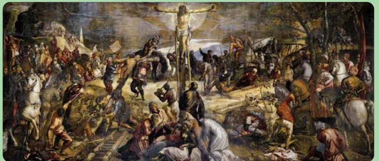
2.6 Jacopo Tintoretto, Kruisiging (1565).