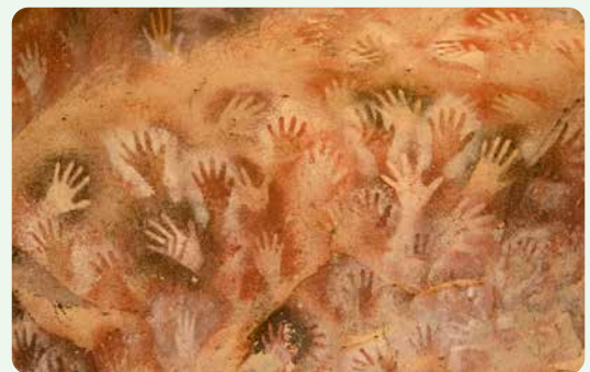
2.11 Onbekend, Grotschildering in Lascaux (10.000-15.000 v.Chr.).