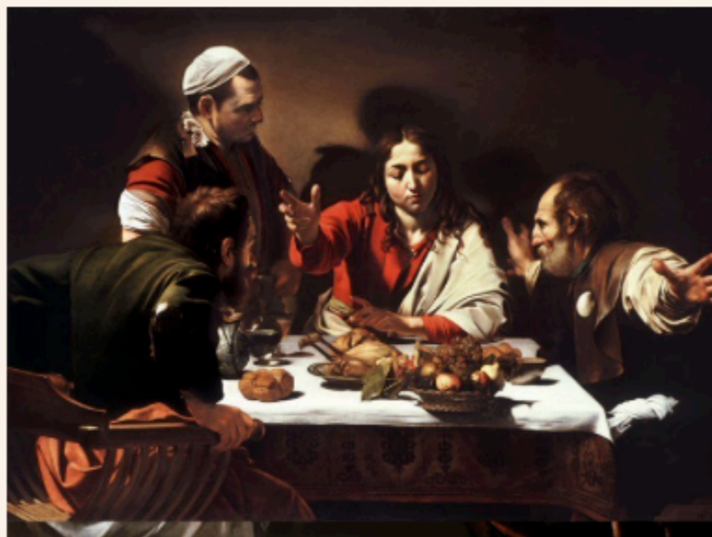
1 Caravaggio, Het avondmaal in Emmaüs (1601-1602).