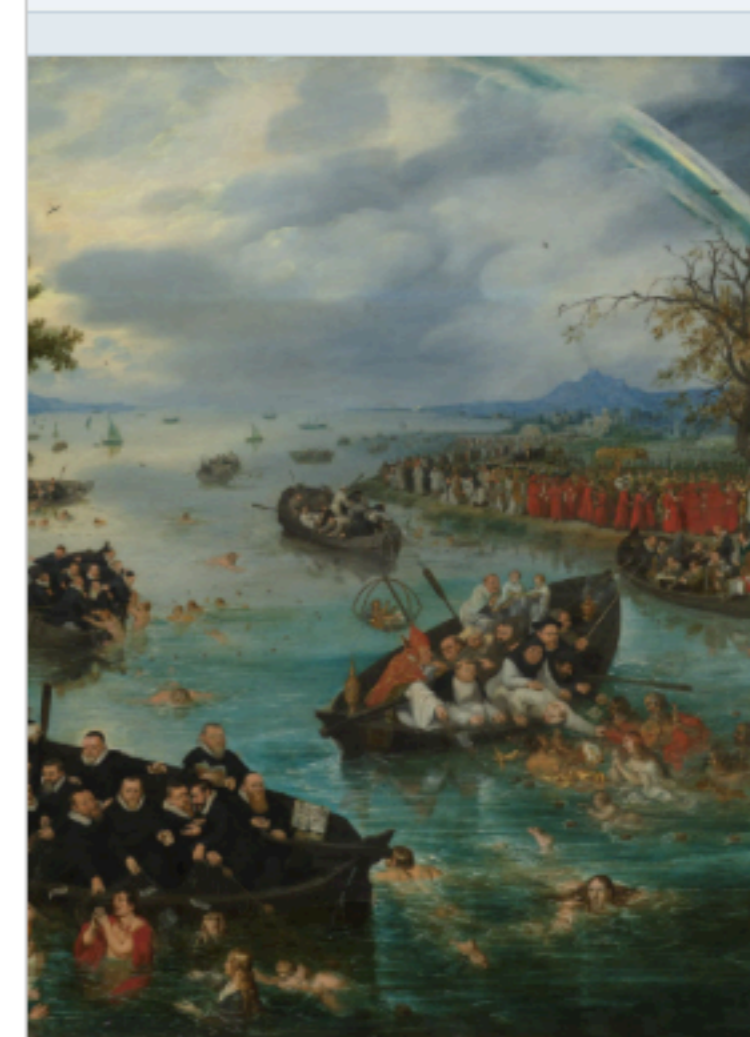
visserij (1614). Op dit schilderij zie je de strijd tussen tholieken (rechts) om de zielen in het midden. Van de nt van de protestanten: aan de linkerkant schijnt de