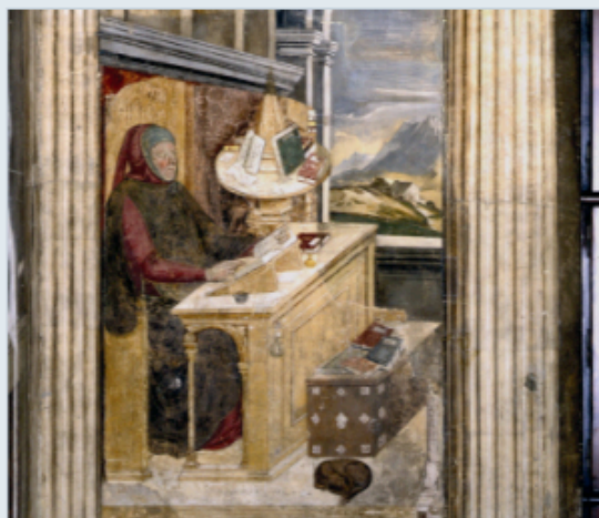
1 Onbekend, Petrarca in zijn werkkamer in Padua (eind 14e eeuw).