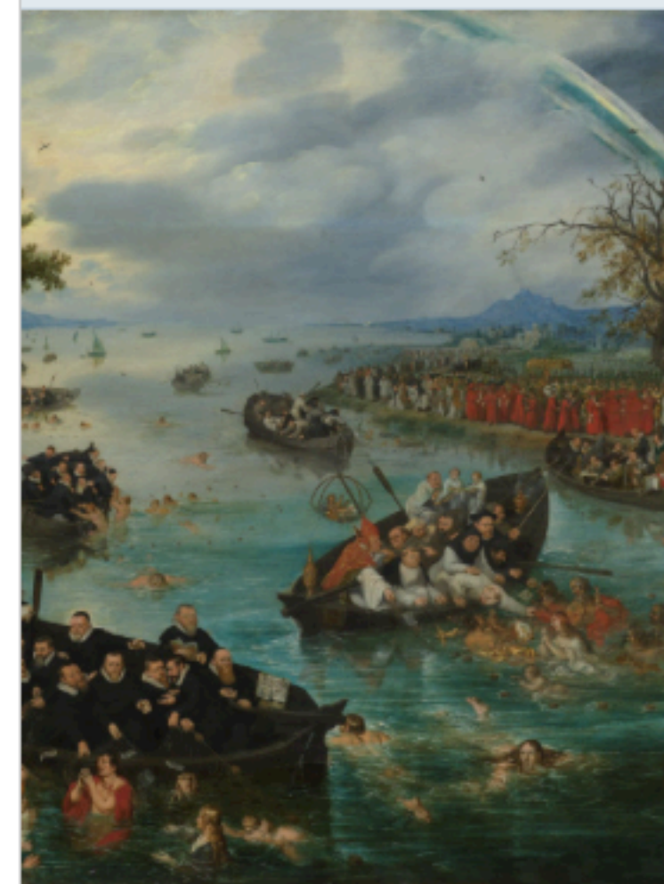
De vissersrij (1614). Op dit schilderij zie je de strijd tussen katholieken (rechts) om de zielen in het midden. Van de kant van de protestanten: aan de linkerkant schijnt de