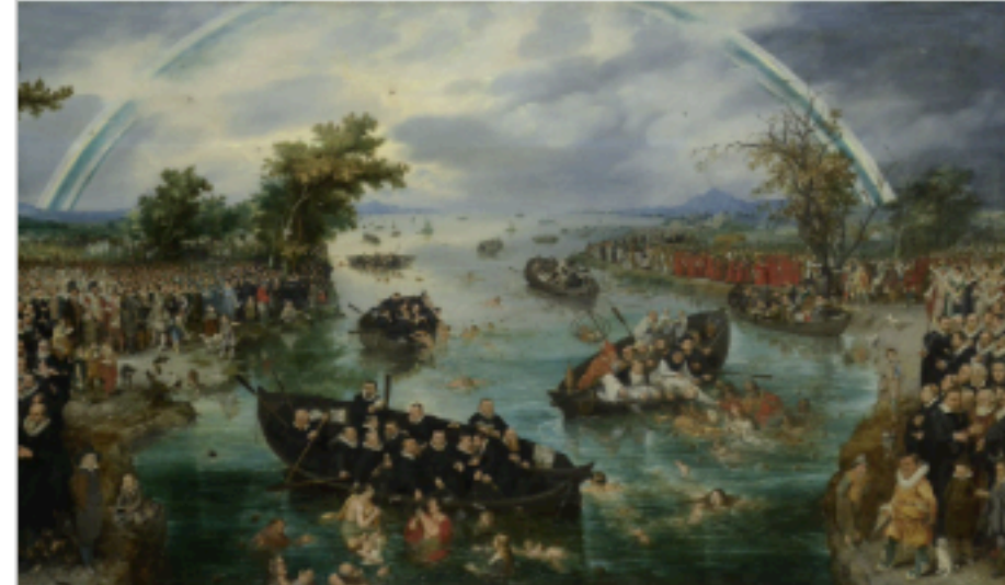
en Pietersz. van de Venne, De zielenvisserij (1614).