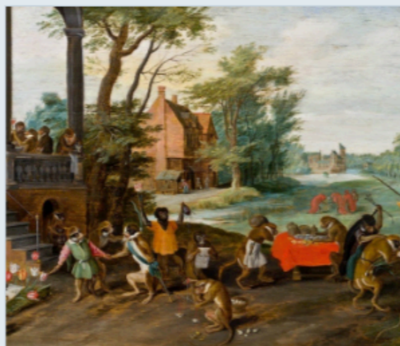
1 Jan Brueghel de Jonge, Satire op de tulpomanie (1640).