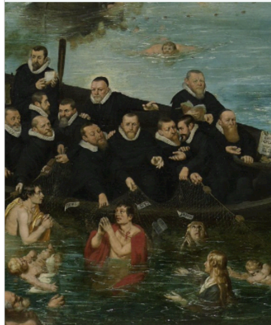
en van de Venne, De zielenvisserij , detail van de protestanten

In vrijwel alle landen van Europa zijn er in de zeventiende eeuw twee verschillende instituten die hoofdzakelijk opdrachten verstrekken aan kunstenaars. In Nederland kent men een afwijkende situatie in die periode wat consequenties heeft voor de ontwikkeling van de kunsten. 1. Welke instituten zijn de traditionele opdrachtgevers in de rest van Europa en in welke twee zaken wijkt de situatie Nederland af?