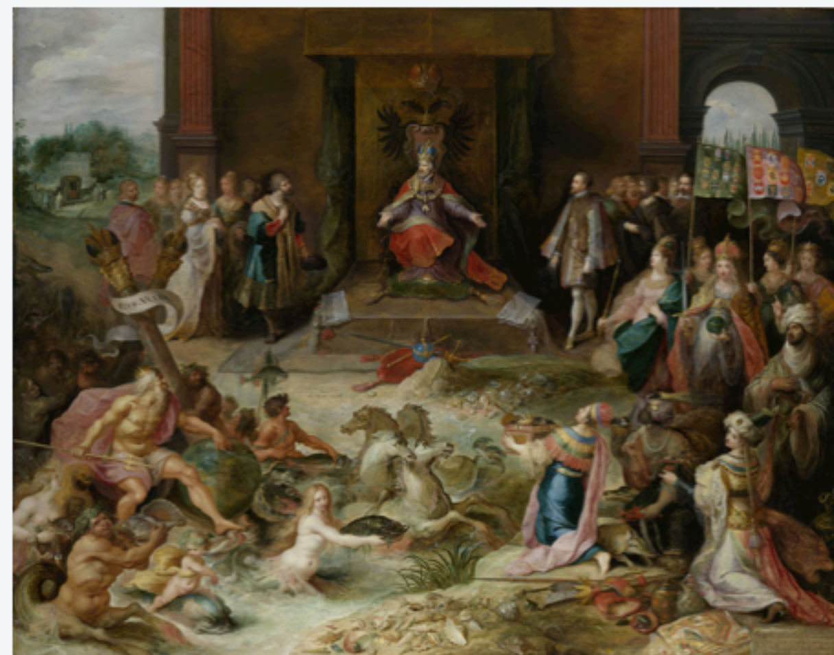
Frans Francken II, Allegorie op de troonsafstand van Karel V , (1640). Op de troon zit Karel V. Hij verdeelt in 1555 zijn rijk onder zijn broer Ferdinand (links) en zijn zoon Philips (rechts). Ferdinand wordt keizer van het Duitse rijk; Philips wordt koning van Spanje en heer van de Nederlanden. De vier figuren rechts op de voorgrond verbeelden de vier werelddelen waarover Karels rijk zich uitstreckte. Neptunus (links) symboliseert Karels macht op zee.