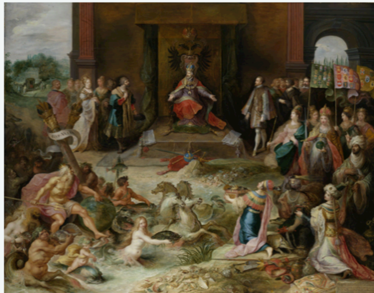
Frans Francken II, Allegorie op de troonsafstand van Karel V , (1640). Op de troon zit Karel V. Hij verdeelt in 1555 zijn rijk onder zijn broer Ferdinand (links) en zijn zoon Philips (rechts). Ferdinand wordt keizer van het Duitse rijk; Philips wordt koning van Spanje en heer van de Nederlanden. De vier figuren rechts op de voorgrond verbeelden de vier werelddelen waarover Karels rijk zich uitstrekte. Neptunus (links) symboliseert Karels macht op zee.

In de vijftiende en zestiende eeuw verandert de maatschappij. Het is een roerige tijd, waarin de wetenschap steeds nieuwe zaken ontdekt. De boekdrukkunst betekent het begin van humanistische geleerdheid. In Italië stelt Galileo Galilei, tot woede van de katholieke kerk, vast dat de aarde om de zon draait en niet andersom. Door deze en andere ontwikkelingen komt de almacht van de Kerk , met Rome als bestuurlijk centrum, onder druk te staan. De uitvinding van buskruit maakt niet alleen de kastelen en burchten van de adel kwetsbaar, maar ook de steden. De ontdekkingsreizen die al in de late middeleeuwen op gang komen, breiden zich uit. De zeventien provinciën van de Lage Landen zijn net als Spanje, Napels en Sicilië onderdeel van het Habsburgse Keizerrijk. Het zwaartepunt van dat rijk ligt in het rijke Vlaanderen met Brussel als hoofdstad. Daar zetelt de in Vlaanderen geboren katholieke vorst Karel V (1500-1558).