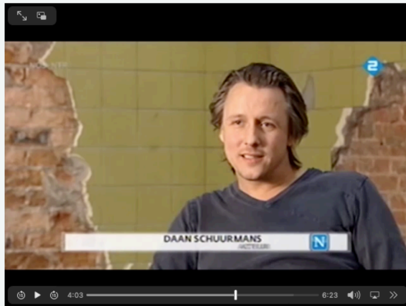
Moderne Gysbreght .

Gysbreght van Aemstel is Vondels beroemdste stuk. Het wordt in 1637 opgevoerd bij de opening van de nieuwe Amsterdamse schouwburg. Het stuk trekt massaal publiek. Het stuk gaat over de geschiedenis van de stad en is gebaseerd op de plundering van de stad Amsterdam in 1304. De stad was toen nog katholiek. Vondel trekt in zijn stuk parallellen met het verhaal over het paard van Troje van de Romeinse dichter Vergilius. In Vondels stuk wordt Amsterdam na een langdurig beleg ingenomen via een list. Die list is bijna identiek aan die waarmee de Grieken Troje veroverden: door soldaten te verstoppen in een houten paard. In Gysbreght is het een schip dat de naam Zeepaard draagt. Die vergelijking met de klassieken is iets dat bij het stadsbestuur in goede aarde valt. De katholieke nachtmis en allerlei ander katholieke zaken in het stuk zien de calvinisten echter minder zitten. Ook de opening op Tweede Kerstdag valt niet goed. De opening en de opvoering van het stuk moet, met wat aanpassingen, worden uitgesteld tot 3 januari.