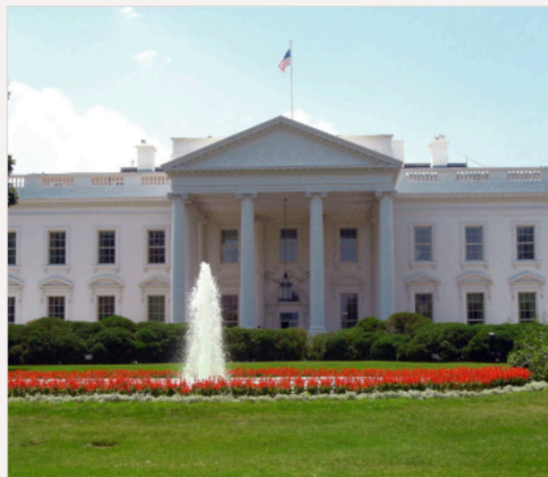
James Hoban en Benjamin Latrobe, Witte Huis, achtergevel, Washington D.C., Verenigde Staten (1815).

In 1790 wordt een ontwerpwedstrijd gehouden om te bepalen wie de opdracht krijgt om het Witte Huis te bouwen. Hoewel er gehoopt wordt op een Amerikaan, wint de Ier James Hoban. Zijn Witte Huis past perfect bij het neoclassicisme, met de volstrekt symmetrische gevel, de zuilen en het timpaan. Deze stijl benadrukt de belangrijke functies van het gebouw: de Amerikaanse president woont en werkt hier. De succesvolle Napoleon laat zich in Parijs omringen met kostbaarheden. Hij zet de trend met een nieuwe stijl: het empire (vernoemd naar het Frans voor 'keizerrijk'). In het Witte Huis komen ook meubels te staan in deze chique stijl. Op de afbeelding zie je de Blauwe Kamer . De ontwerpen zijn geïnspireerd op die van de Egyptenaren, Romeinen en Etrusken: strak met gebogen vormen. De ornamenten van het empire zijn vaak Romeinse symbolen die verwijzen naar overwinningen, zoals adelaars, laurierkransen, zwaarden en helmen met pluimen. De meubels zijn sierlijk en van kostbaar materiaal gemaakt.