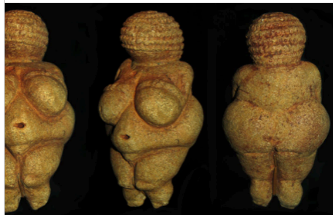
Willendorf, kalksteen, 11 cm hoog (ca. 24.000-22.000 v. Chr.).