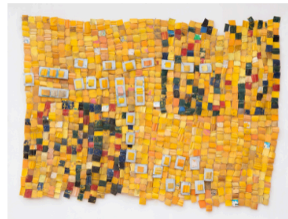
Serge Attukwei Clottey, Make it possible (2017).

Meer kunstenaars houden zich bezig met klimaatverandering en recyclen. Zij gebruiken bijvoorbeeld afval om kunst te maken en een boodschap over te brengen. Zo ook de kunstenaar Serge Attukwei Clottey.