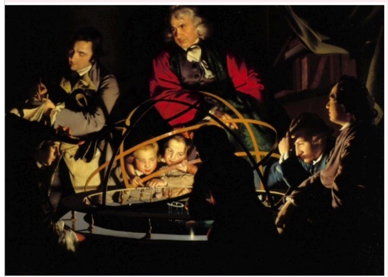
Joseph Wright of Derby, Een wetenschapper geeft een lezing over het zonnestelsel (ca. 1766).