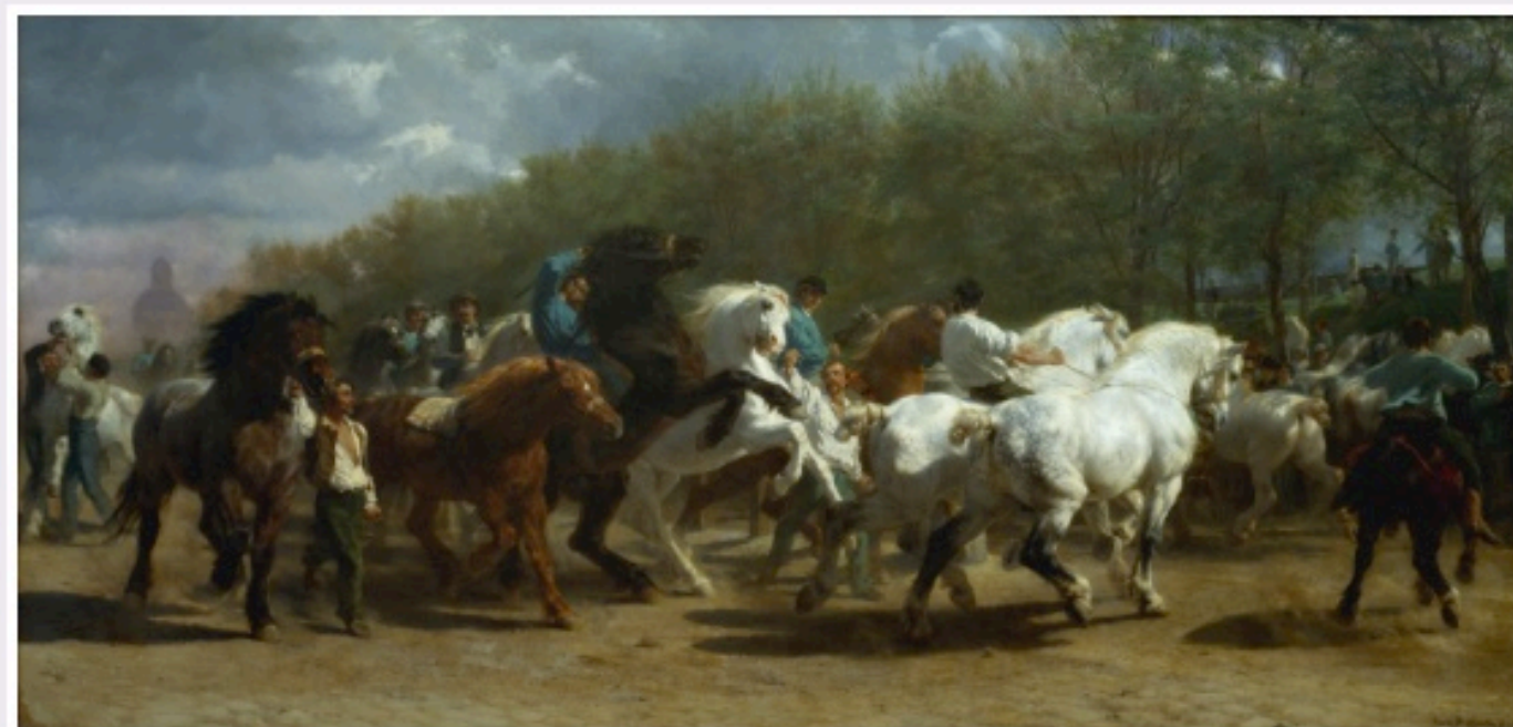
Rosa Bonheur, De paardenmarkt (ca. 1853).

De paardenmarkt is te zien geweest op de Parijse Salon. Ook van Mary Cassatt en Berthe Morisot is af en toe werk te zien. Wel is dat werk uit hun vroege periode, waarin zij nog voldoen aan de neoclassicistische eisen. Hun latere werk, waarin zij niet langer in die stijl schilderen, wordt vaak door de conservatieve jury geweigerd.