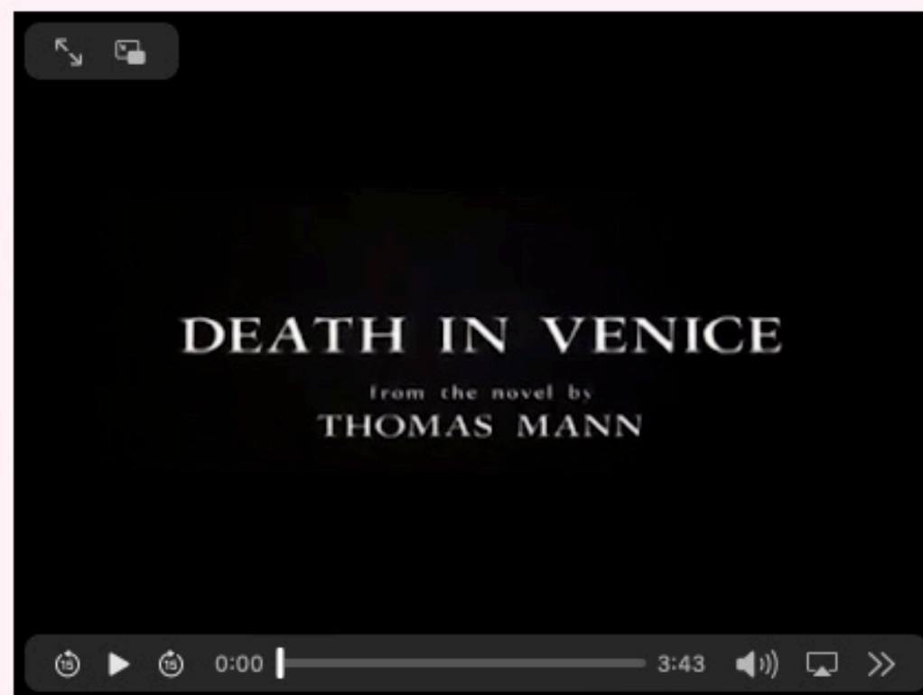
Luchino Visconti, Death in Venice , fragment (1971).