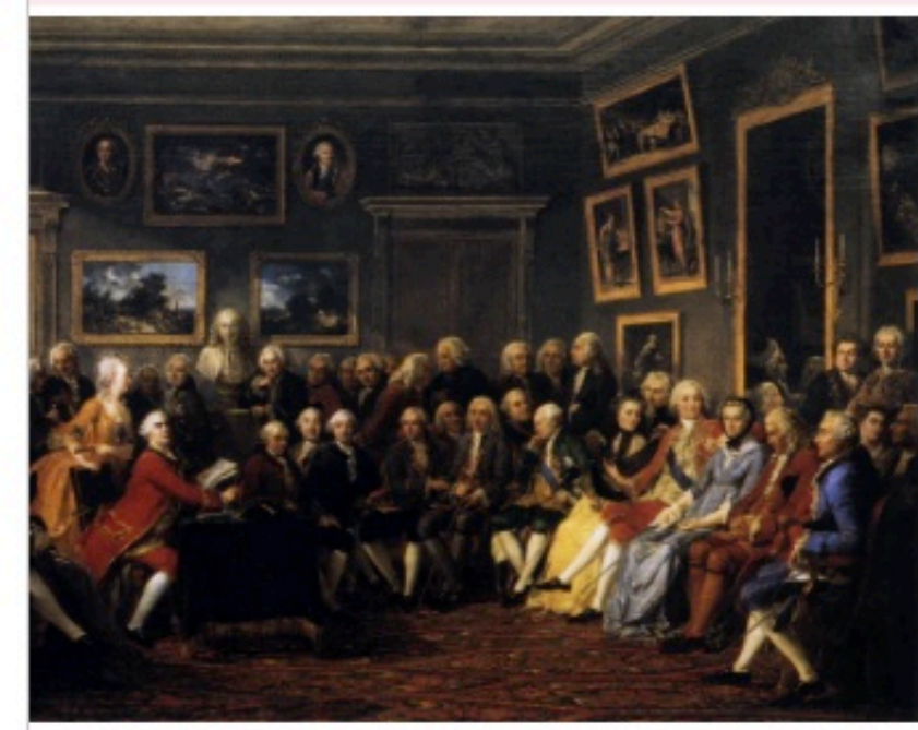
nnier, De salon van Madame Geoffrin in 1755 (1812).

De salon van Madame Geoffrin in 1755 van Anicet is een uitbeelding van een bekende salon in het Parijs van de achttiende eeuw. Je ziet Madame Geoffrin, een Franse aristocratische vrouw, omringd door intellectuelen, kunstenaars en geleerden die zijn versameling. Het schilderij laat de intellectuele en sociale sfeer van de saloncultuur zien, waar de saloncultuur een belangrijke rol speelde in het uitwisselen van ideeën en het stimuleren van debatten.