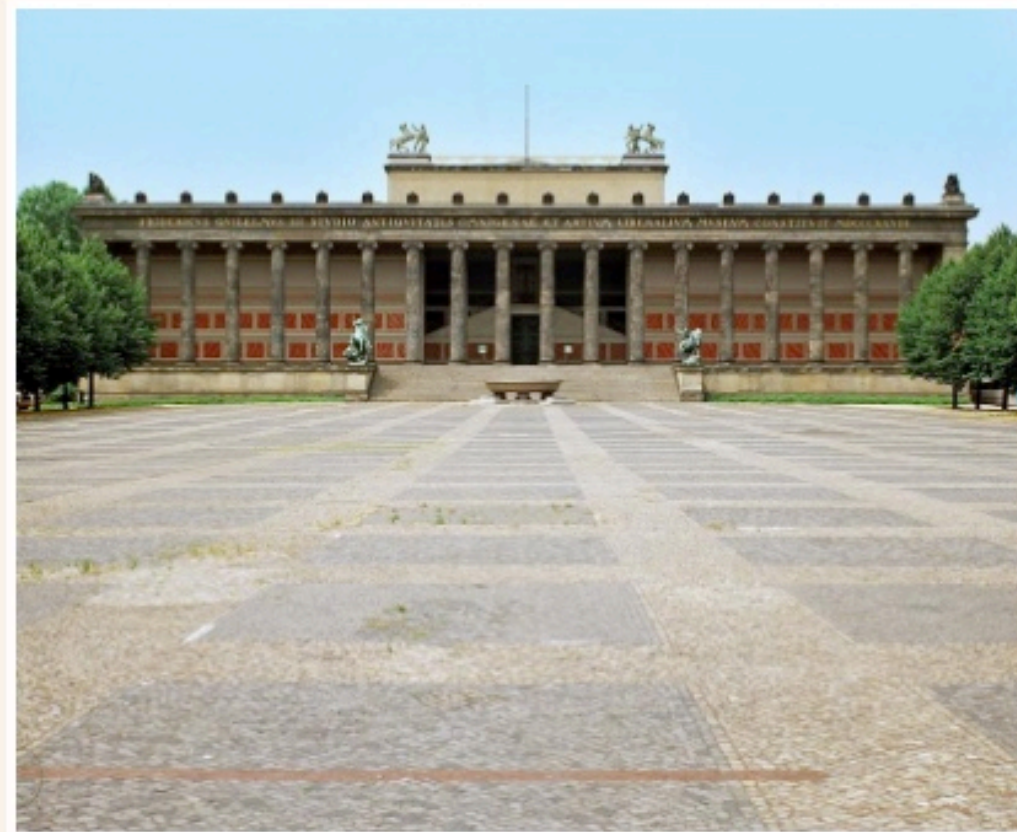
1 Friedrich von Schinkel, Alte Museum (1823-1828).