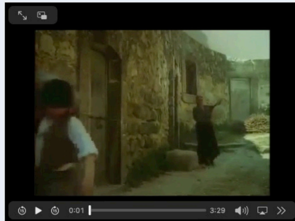
1 Pietro Mascagni, Cavalleria Rusticana , fragment uit de verfilming van Franco Zefirelli (1982, oorspr. 1890).