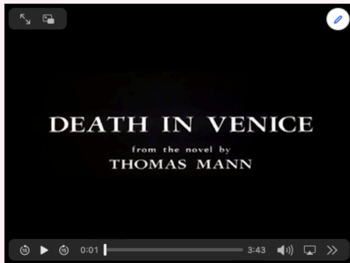
Luchino Visconti, Death in Venice , fragment (1971).