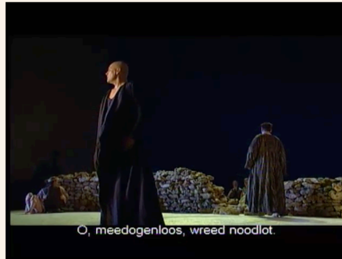
1 Claudio Monteverdi, L'Orfeo , fragment (1607).