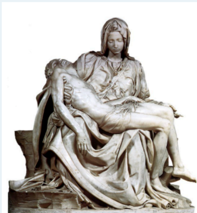
1 Michelangelo, Piëta (1499).