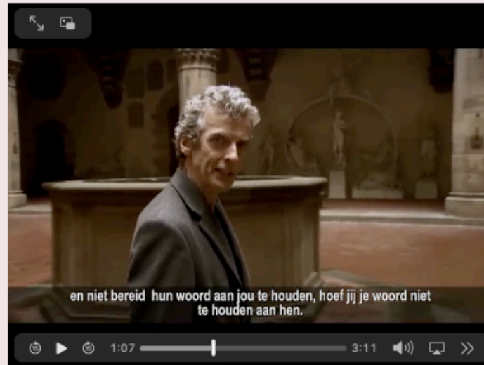
1 BBC, Niccolo Machiavelli , fragment (2016).