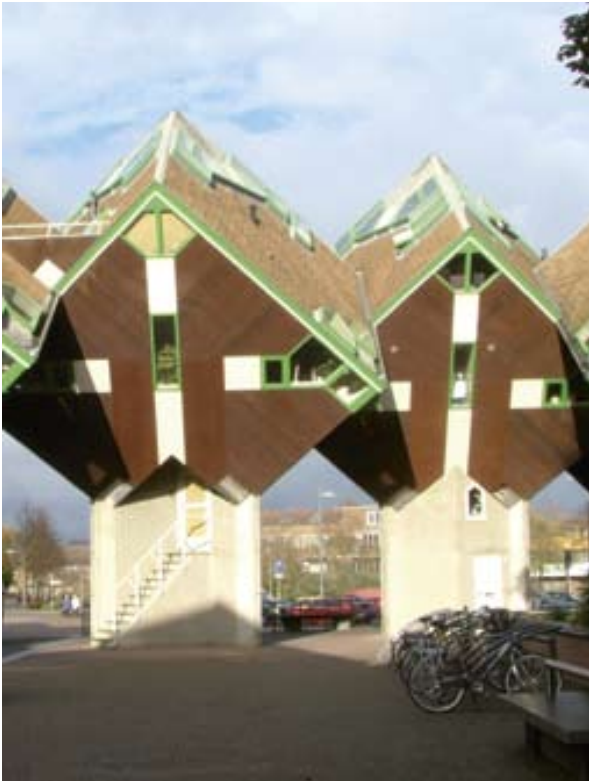
Afbeelding 1. Piet Blom: Kubuswoningen (Helmond), 1974-1975