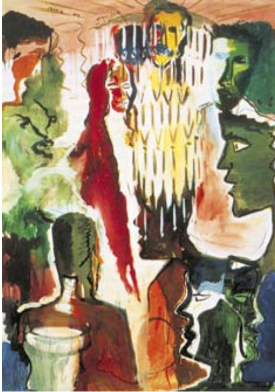
Afbeelding 1. René Daniëls: Palais des Beaux-arts , 1983