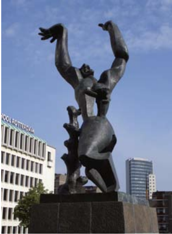
Afbeelding 1. Ossip Zadkine: De verwoeste stad (Rotterdam), 1953