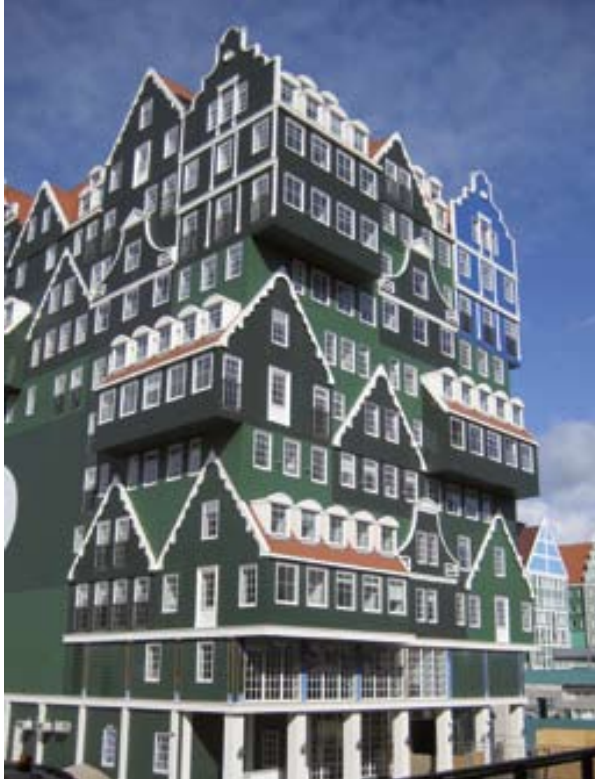
Afbeelding 3. Molenaar & Van Winden architecten / WAM architecten: Intel Amsterdam-Zaandam (Zaanstad), 2008-2010