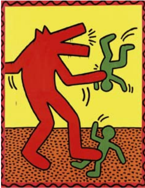
Afbeelding 5. Keith Haring: Untitled , 1982