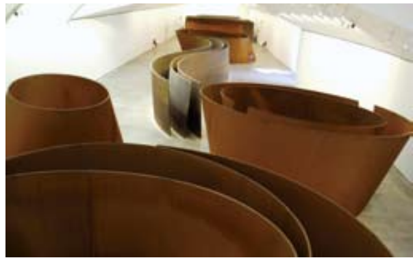
Afbeelding 5. Richard Serra: The Matter of Time , 2005