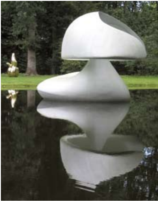
Afbeelding 4. Martha Pan: Drijvende Sculptuur , 1961