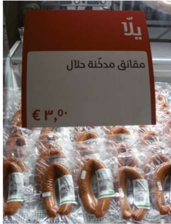
Afbeelding 2. Mediamatic: halal rookworsten uit het assortiment van El Hema, 2007