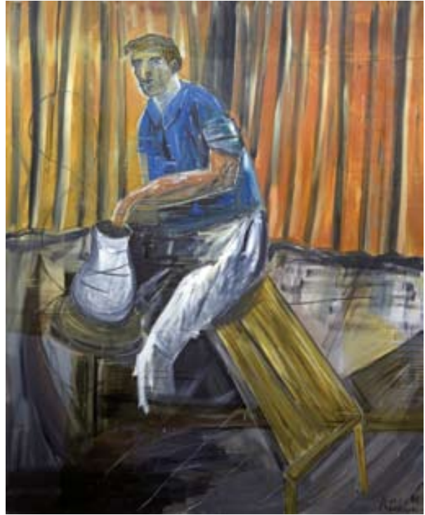
Afbeelding 2. Albert Oehlen: Zelfportret , 1986