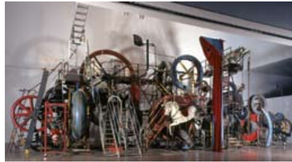
Afbeelding 3. Jean Tinguely: Grosse Méta Maxi-Maxi Utopia , 1987