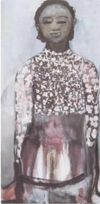
Afbeelding 3. Marlene Dumas: Ivory Black , 1997