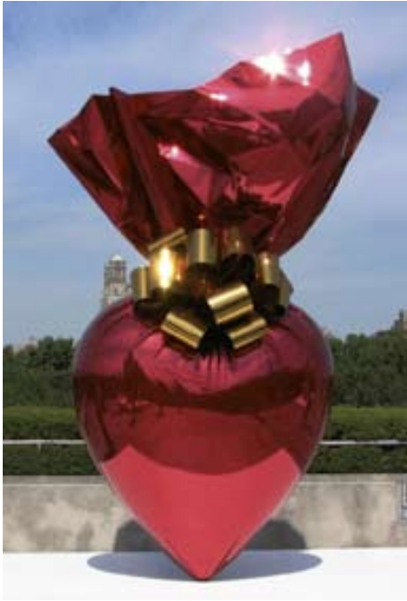
Afbeelding 1. Jeff Koons: Sacred heart , 1994-2007