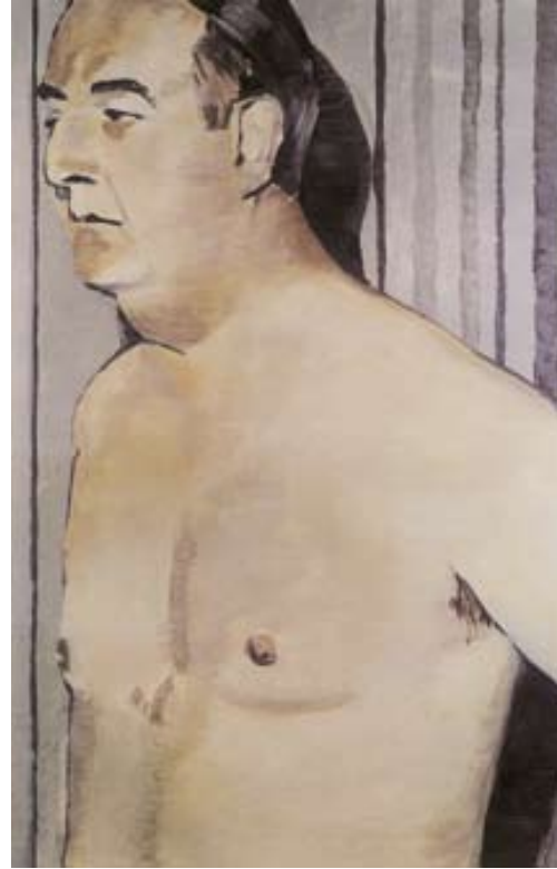
Afbeelding 4. Luc Tuymans: der diagnostische Blick IV , 1992