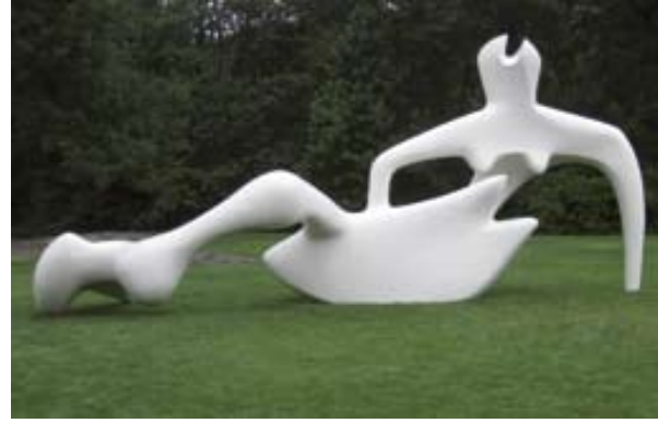
Afbeelding 2. Henry Moore: Liggend figuur , 1984