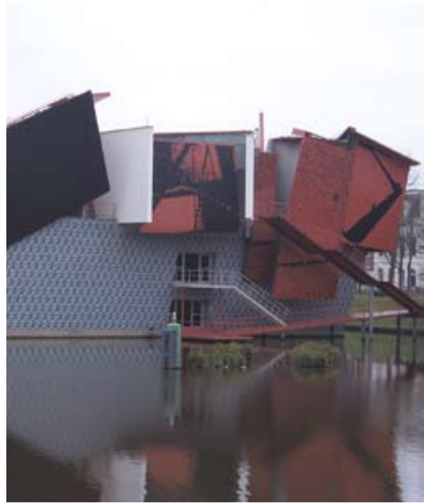
Afbeelding 6. Alessandro Mendini e. a.: Groninger museum, 1992-1994