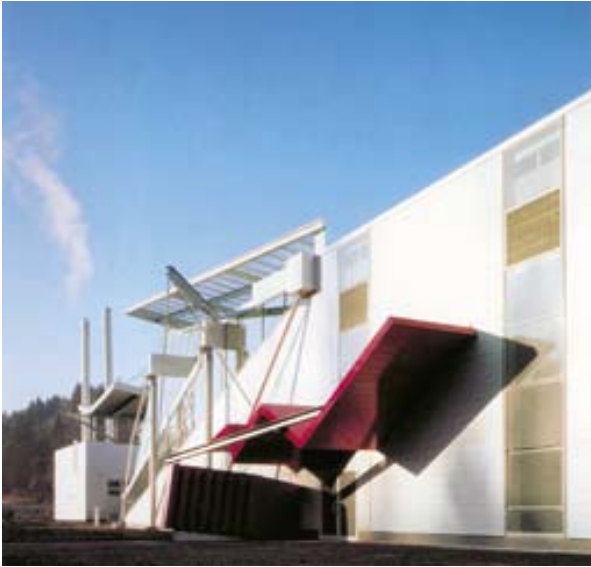
Afbeelding 5. Coop Himmelblau: Ingang Fabriek, St. Veit, 1988-1989