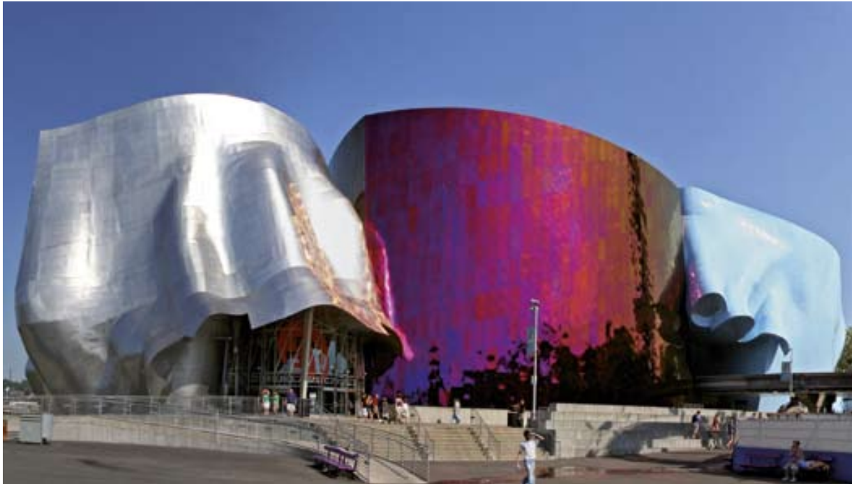
Afbeelding 7. Frank O. Gehry: Experience Music Project in Seattle (Washington), 1996-2000

zoals het 'wapperende' deel van het gebouw links op afbeelding 7. Elk van de 21.000 platen waarmee het gebouw bekleed is, heeft een eigen, specifieke vorm. De unieke vorm en afmetingen van elke plaat zijn afgestemd op de specifieke plaats die de plaat in de bekleding van het gebouw toegekend wordt.